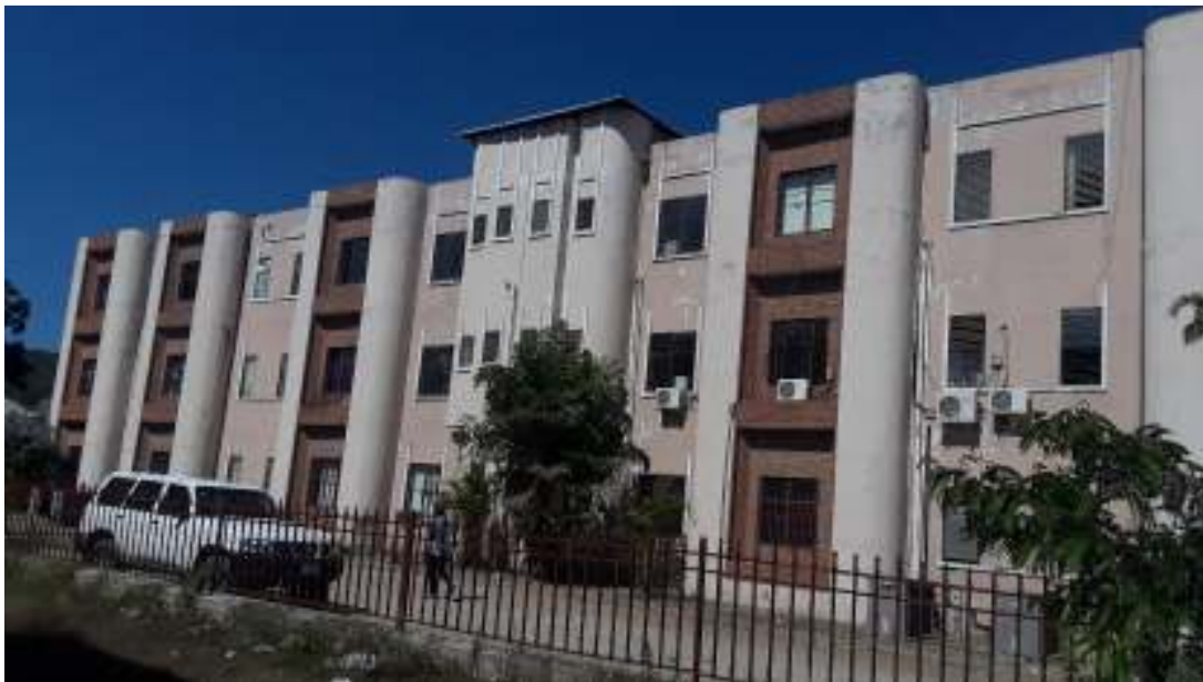
Complexe administratif de Hinche, logeant le CTE

Hinche est une commune d'Haïti de l'arrondissement de Hinche située dans le département du Centre. La zone urbaine (centre-ville) est très développée sur la partie OUEST de la Route Nationale qui la traverse, de Port-au-Prince vers le Cap-Haitien. L'alimentation en eau potable de la ville de Hinche repose actuellement sur l'exploitation du réseau gravitaire de la source Layaye qui est en cours de réhabilitation par la firme INCATEMA: