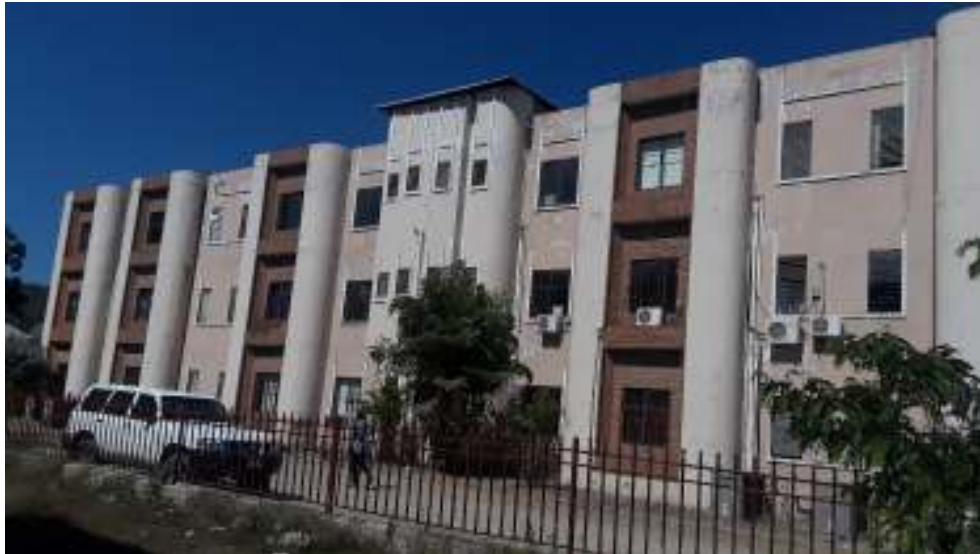
Complexe administratif de Hinche, logeant le CTE.