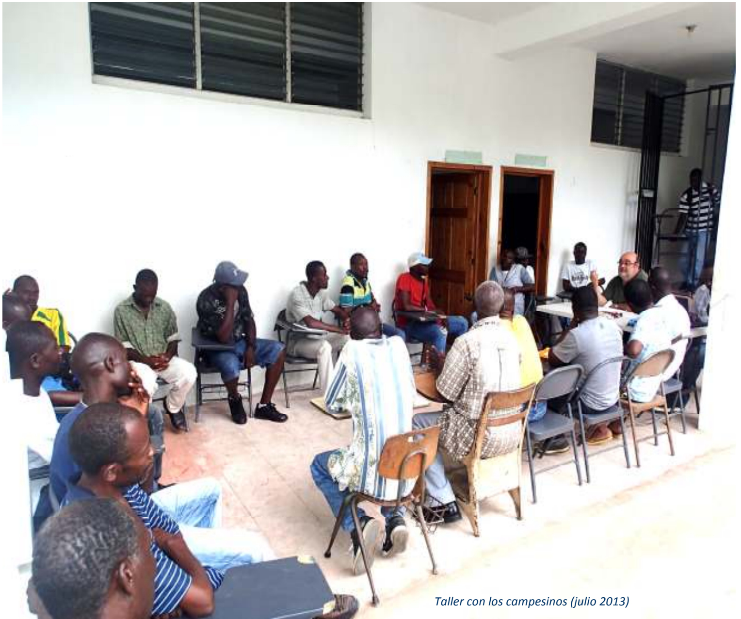
Taller con los campesinos (julio 2013)