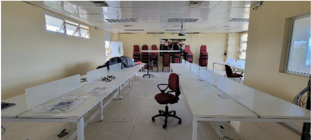
Figure 2 Vue de la salle informatique