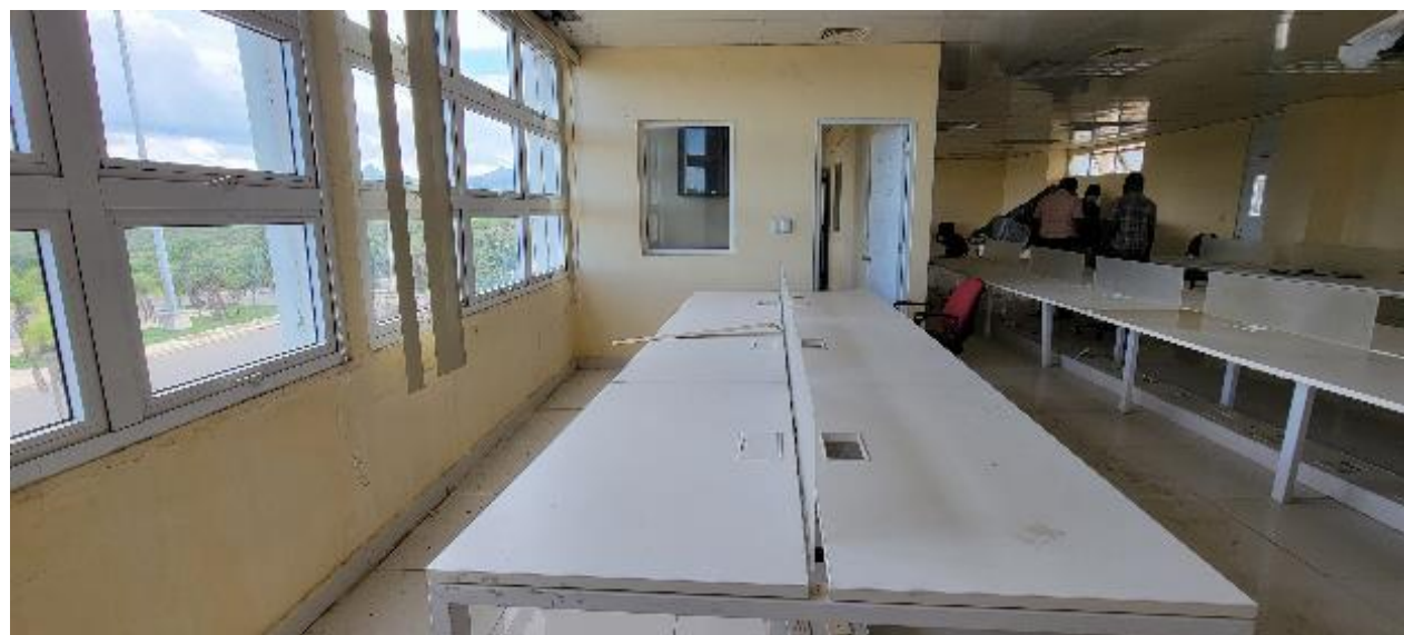
Figure 1 Vue de la salle informatique