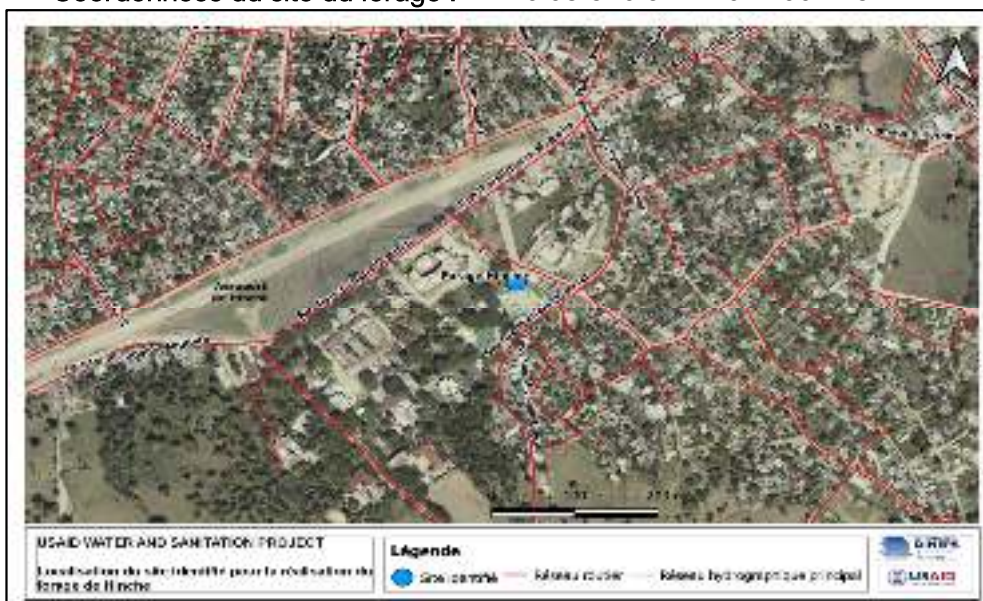
Figure8 : Localisation du site identifié pour le forage

Coordonnées du site du forage : N : 19°08.316 et W : 072°00.773