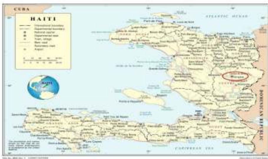
Figure5 : Situation géographique de Hinche

La ville de Hinche est une agglomération du département du Centre. La commune de Hinche est délimitée par les communes suivantes : au nord, Cerca Carvajal; au sud, Tomassique; à l'est, Cerca la Source et à l'ouest, Maïssade. Les cartes suivantes permettent de situer la ville.