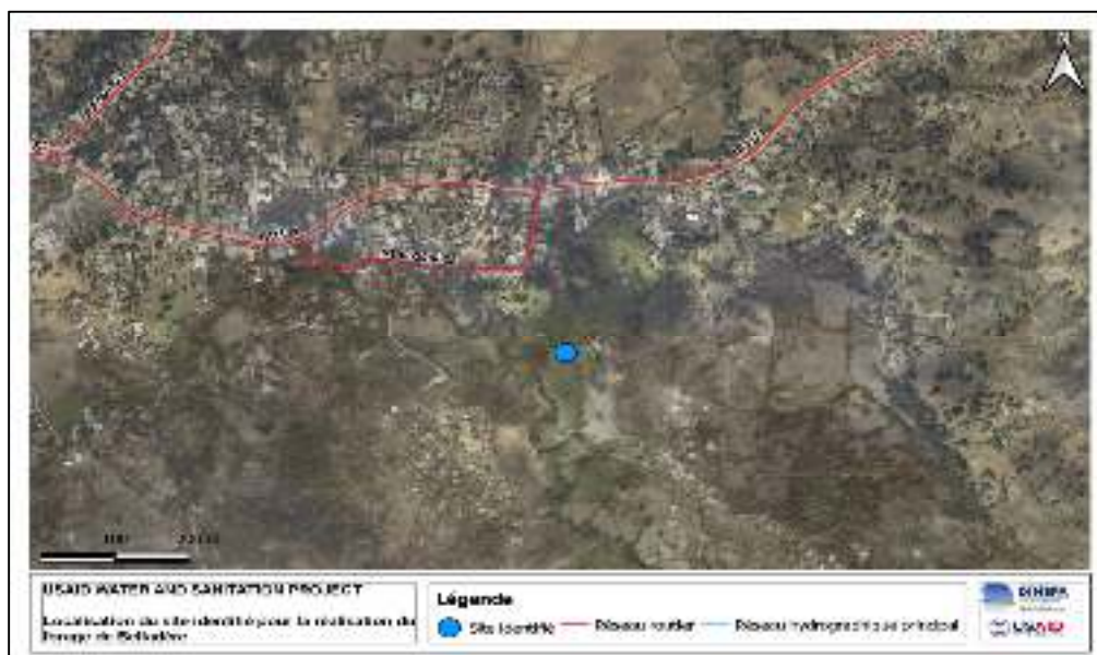
Figure 4 : Localisation du site identifié pour le forage de