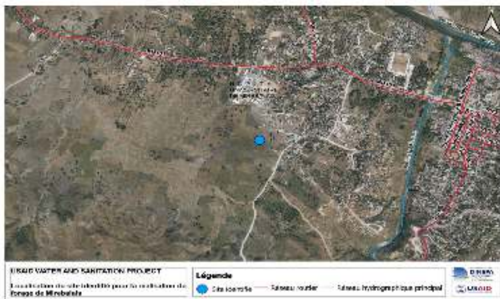
Figure 10: Localisation du site identifié pour le forage de

Coordonnées du site du forage : Latitude : 18°83.2757 et Longitude -72°11'6430