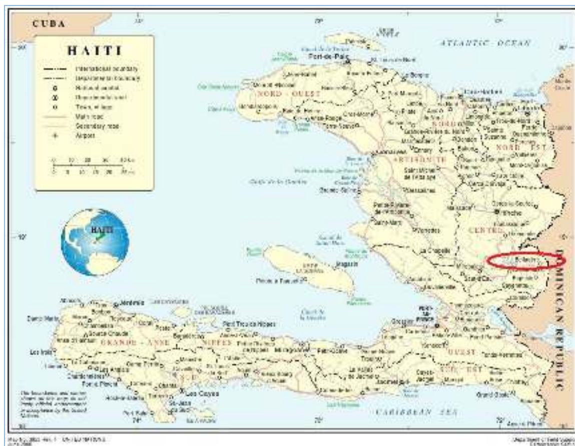
Figure 1: Situation géographique de la ville de Belladère